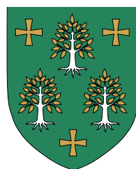
II. Kerületi Önkormányzat